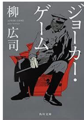
『ジョーカー・ゲーム』 柳広司